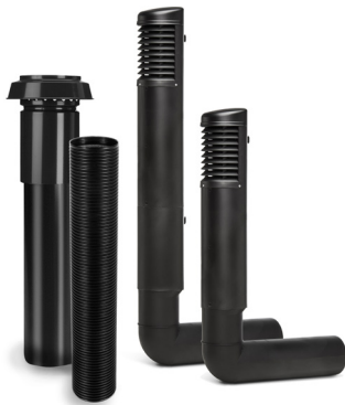
Geïsoleerde luchtkanalen met grotere diameter