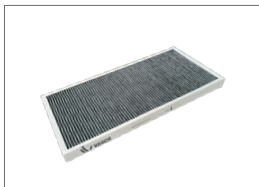
Actiefkool filter Filterset: 2x Coarse