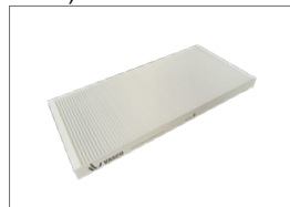
Antismog filter Filterset: 2x ePM1 80% (=F9)