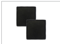
Prefilter Filterset: 2x Coarse