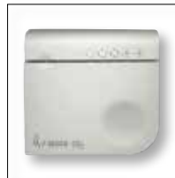
CO 2 RF bediening