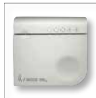
RH RF bediening