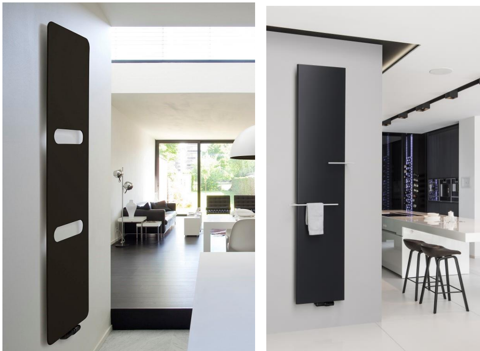
Neuheiten 2021: Vasco Design-Heizkörper Oni (l.) und Niva (r.) mit Mittelanschluss und schwarzer Ventilgarnitur.

Design-Neuheit 2021: Schwarze Design-Heizkörper für edles Ambiente / Perfektion pur: Ventilgarnitur in gleicher Farbe