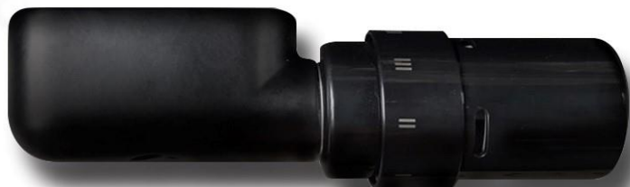
Neuheit 2021: Ventilgarnitur in edlem Schwarz für Vasco Design-Heizkörper mit Mittelanschluss.

I-Tüpfelchen dieser neuen Kollektion ist die passende Ventilgarnitur in Tiefschwarz (Jet Black, RAL 9005). Ton in Ton perfektioniert das Zubehörelement das optische Erscheinungsbild der schwarzen Design-Heizkörper. Die stimmige Einheit aus Heizkörper und Armatur wird verstärkt, da keine Schweißnähte sichtbar und die Ventile diskret in den Korpus integriert sind.